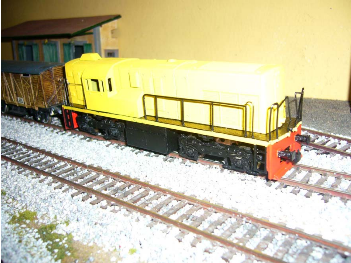
Aspecto de la locomotora una vez dada la primera mano de pintura, amarillo en la carcasa para posteriormente enmascararlo.